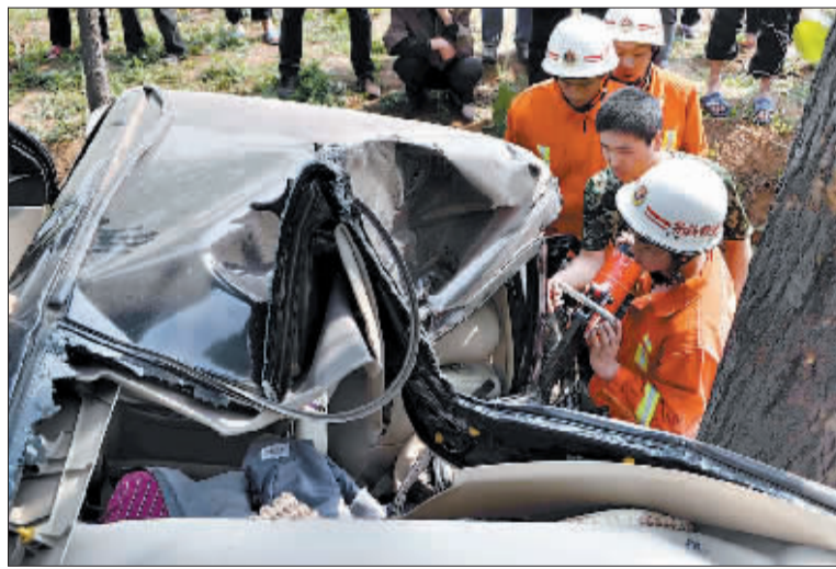
消防队员紧急营救伤者。

随后,消防队员使用液压扩张器、机动切割机、撬杠等救援工具,将紧紧“咬”住伤者双腿的金属向四周扩张。经过45分钟紧急营救,消防队员成功将受伤人员救出。随后,伤者被抬上救护车送往医院救治。