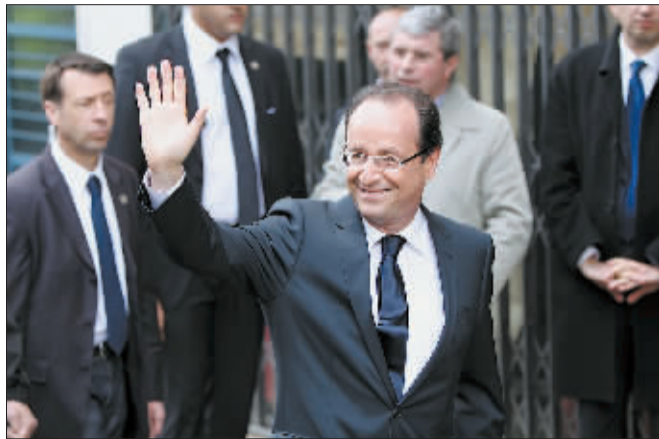
奥朗德(前)抵达法国南部城市蒂勒的一个投票站投票。