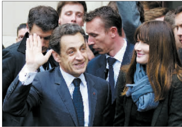
萨科齐(前左)与妻子布吕尼抵达法国巴黎的一个投票站。