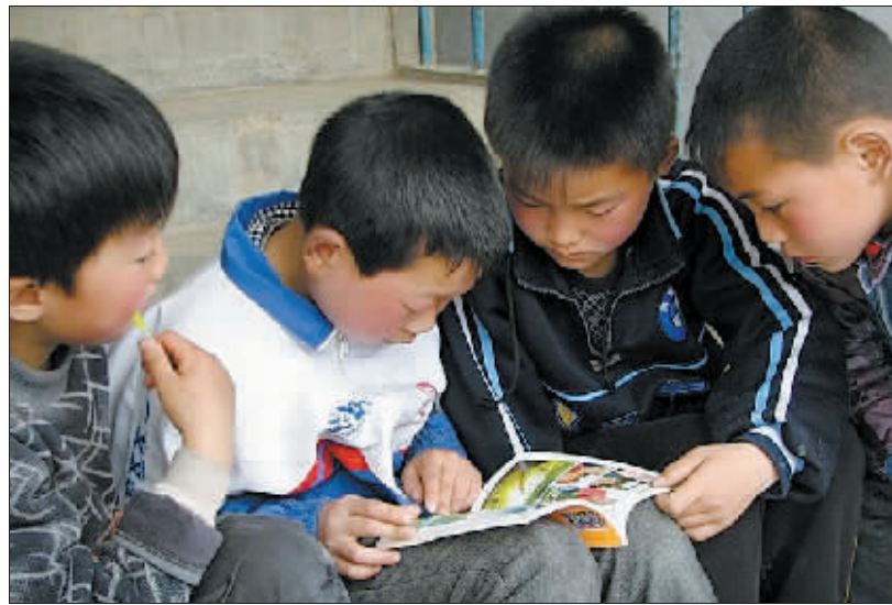
山区孩子在专心地看驴友带去的图书。

目前,“毛遂自荐”已在洛阳网上发帖,将本次活动的主要内容、行程安排作了详细介绍。记者从“毛遂自荐”处了解到,本次活动报名截止时间为5月11日18时,您如果想参与,请拨打13837993346咨询“毛遂自荐”。