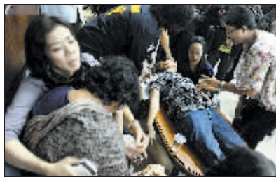
坠毁客机乘客的家属悲痛欲绝。