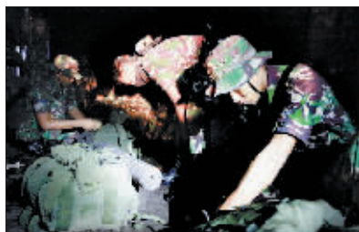
印尼军警准备搜寻失踪俄客机的残骸。

印尼国家搜救中心10日说,继当天早些时候在西爪哇省山区发现坠毁的俄罗斯新型客机残骸后,已找到部分遇难者遗体,尚未发现生还者。