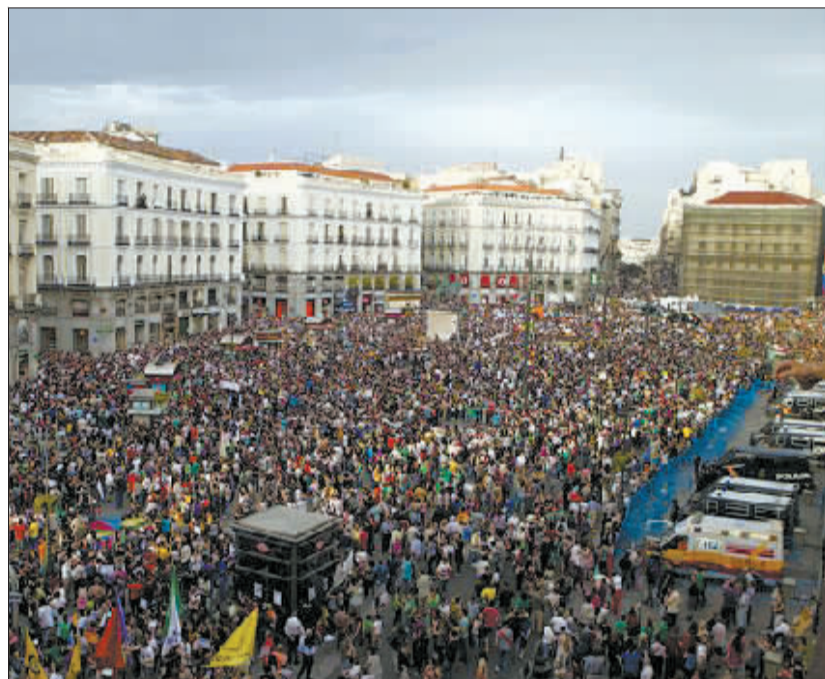
5月12日,马德里的示威者聚集在太阳门广场抗议。

去年5月15日,西班牙成千上万的青年人、失业者和退休者加入示威浪潮,抗议政府的紧缩政策和高失业率,一场声