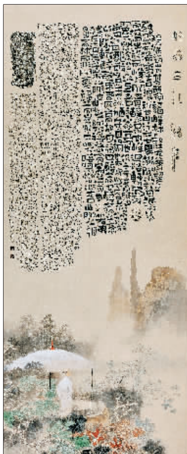
本版书法作品均由张焉如提供。