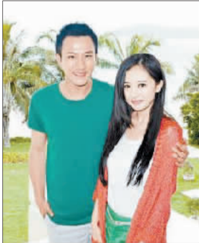
杨幂与刘恺威片场秀甜蜜。