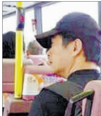
周润发搭巴士自称很舒服。

周润发虽然已是国际巨星,但56岁的他依旧很平民化,有名车不坐,选择和百姓挤巴士和地铁。发哥听到有人说他“贱骨头”,曾笑得合不拢嘴,解释道:“好多人都说周润发‘沦落’了,搞到挤巴士!但我过海打死都不会开车。其实,搭巴士真的很方便,不用理会停车问题,可以坐几百万一辆的Volvo(巴士),又有强劲冷气、真皮车座,真是很舒服!只要20分钟,就可以过海……”