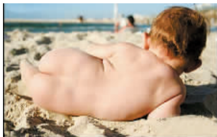
时尚女人荟:人生苦短,必须性感。