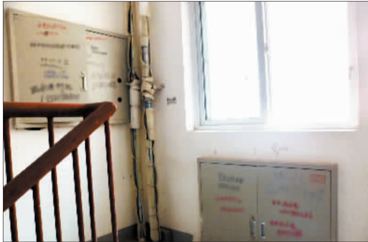
小区楼道内小广告真不少。