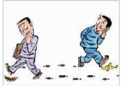
▲嘲笑别人之前最好先看看自己的脚下