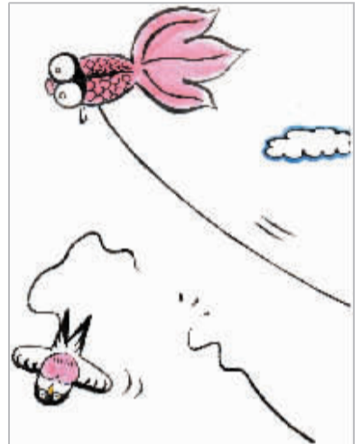
▲必要的约束也是一种保护