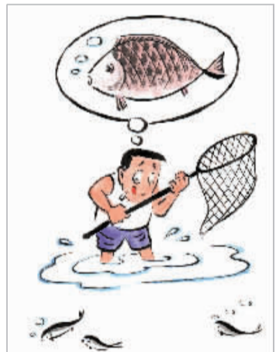
▲不要抱怨机遇太少,而是我们需要的太多