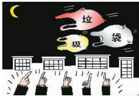
▲快看,不明飞行物! 赵玉宝(newscartoon 供稿)