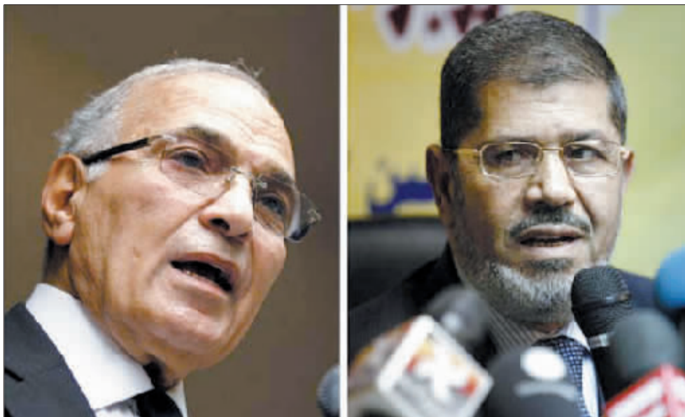
在5月23日至24日的埃及总统选举首轮投票中,得票最多的两名候选人穆尔西(右)和沙菲克。