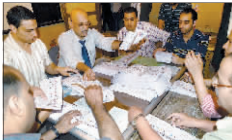
5月24日,在埃及各地的投票站,工作人员在统计选票。