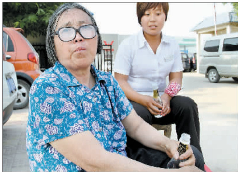
流落商丘的老太太

昨日下午,本报记者和商丘市救助站取得了联系,办公室一名姓蔡的工作人员说,26日,他们接到老太太后,发现