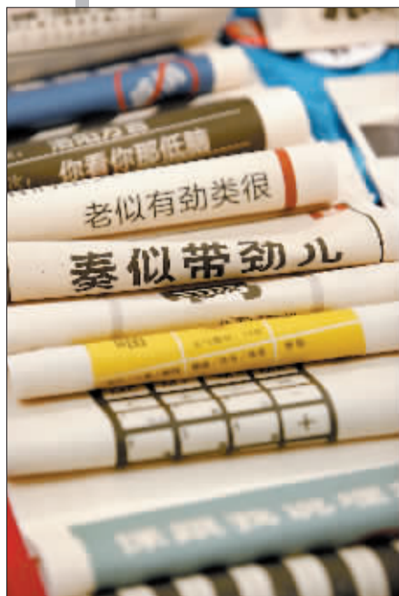
用这样的布袋“奏似带劲儿”。