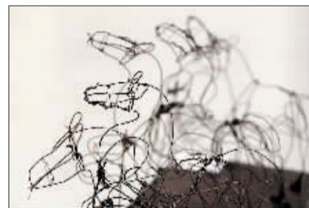
用铁丝编制的天子驾六