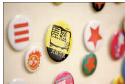
洛阳大话方言胸章