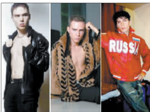
马尼奥塔