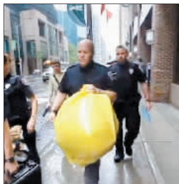
警方提走装有手脚的包裹。