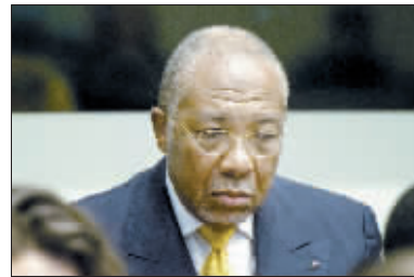
泰勒在等待判决结果。