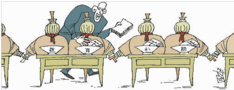
▲草人借钱 盖桂保(山东)