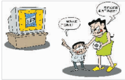
▲都是它教的 郝延鹏(news cartoon 供稿)