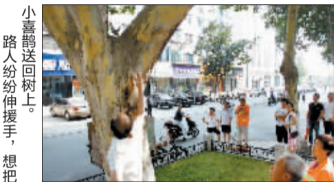
小喜鹊送回树上。路人纷纷伸援手,想把