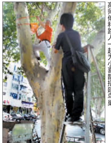
高师傅和路人一起为小喜鹊搭建鸟巢。

对此,河南科技大学林业职业学院动物标本馆馆长刘玉卿介绍,每年的五六月份易发生雏鸟从鸟巢爬出坠落的意外。一般说来,大喜鹊有能力救助自己的孩子,雏鸟如受轻伤也会自己痊愈,这时如果人们去关注它,反而会惊扰大喜鹊,使它们不敢下来将雏鸟叼回鸟巢;如果市民好心把小鸟带回家,反倒会增加雏鸟的死亡率。