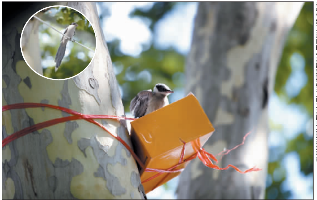
被安置到鸟巢内的小喜鹊活泼起来,而大喜鹊只是远远地看着。