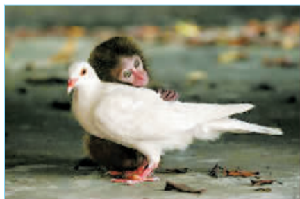
总有新鲜感:我要我们在一起,永远不分离!