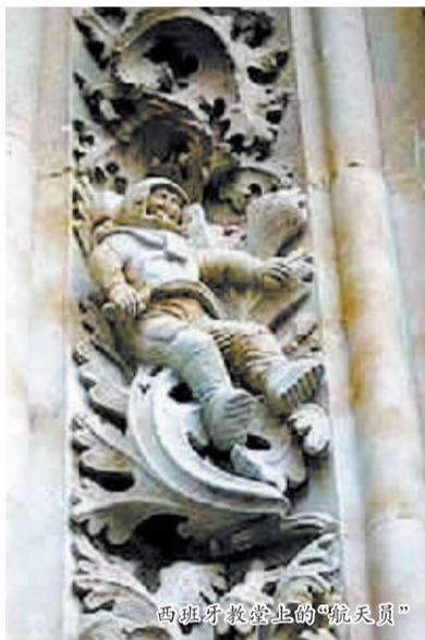
西班牙教堂上的“航天员”

在20世纪50年代末,考古人员曾在浙江海宁的马家浜文化遗址发掘出一块陶片,陶片上刻有一个似人似猿的头像,头像的外面套有一个封闭式的头盔,头盔左侧还有一个带状的装饰物。因出土时陶片残缺,无法推测带状装饰物与头盔相连的是什么东西。这个“航天员”形象,令考古人员大为惊讶。