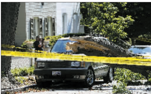
的大树。居民拍摄在暴风雨中被风吹倒的树木。在美国首都华盛顿，一名当地居民拍摄在暴风雨中被风吹倒的树木。