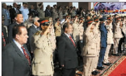
穆尔西(前排左三)在开罗东郊一军事基地出席阅兵仪式。