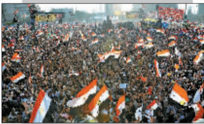
穆尔西的支持者聚集在开罗市中心。