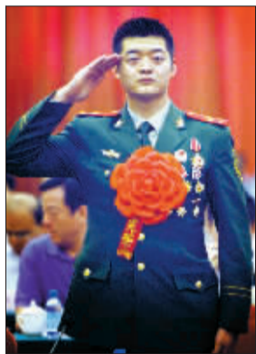
全国特级优秀共产党员李鹏