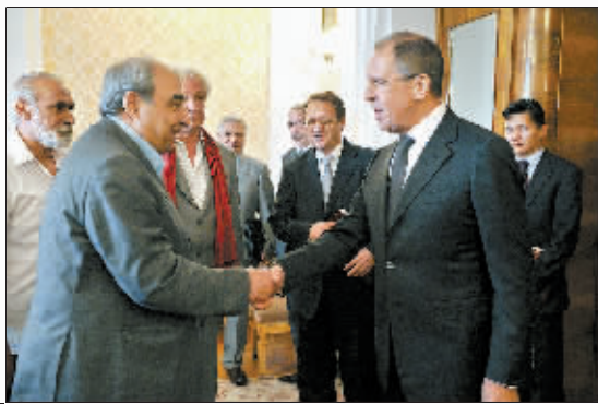
7月9日,俄罗斯外交部部长拉夫罗夫(右前)在莫斯科会见叙反对派代表团成员。