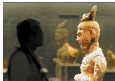
一名游客在洛阳博物馆《河洛文明展》的展厅内欣赏唐代彩绘文官俑。(2011年6月22日摄)