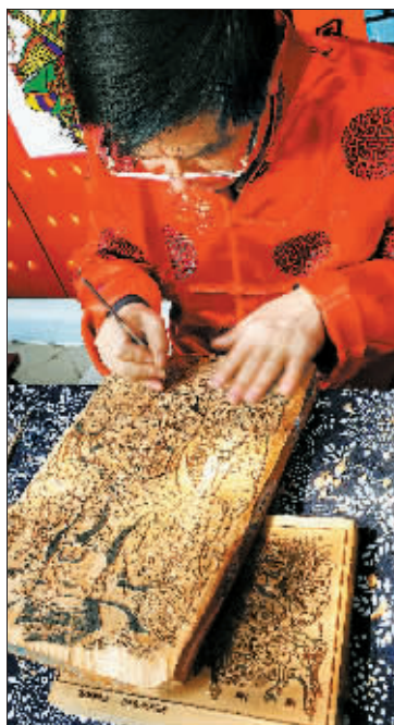
在洛阳民俗博物馆内,一名艺人在刻制传统木板年画的模板。(2009年四月十一日摄)

近年来,“十三朝古都”洛阳依托厚重的历史文化资源,全力推动文博事业发展。据统计,目前洛阳已开放和正在建设的国有博物馆分别为13家和5家,民营博物馆除了已经建成的9家外,还有十几家正在积极筹建或申办过程中。全市已初步形成包括各类历史博物馆、文化艺术博物馆、专题博物馆在内的、具有浓郁地方特色的博物馆群,无论是数量还是种类,都位居全省首位、国内同等城市前列。这些博物馆为广大市民和游客提供了培育民族情感、进行爱国主义教育的场所和展示文化遗产、参与艺术鉴赏的文明殿堂,同时对提高城市文化品位也发挥了积极作用,有力助推了洛阳打造国际文化旅游名城和“博物馆之都”的步伐。