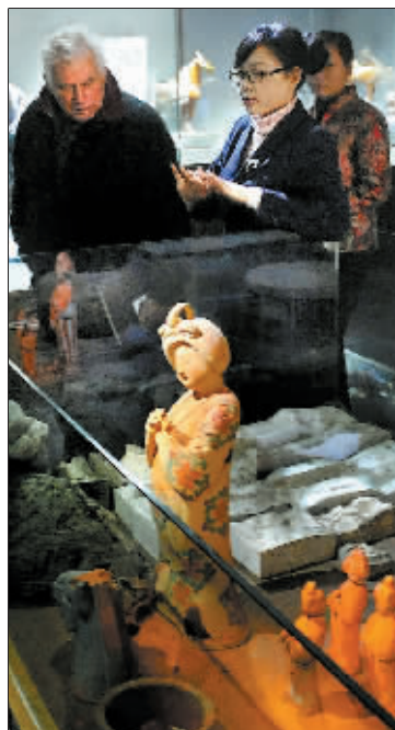
在洛阳唐三彩博物馆内,一名外国游客在聆听讲解员介绍唐三彩的制作工艺。(2011年十一月十八日摄)