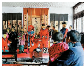
游客们在洛阳民俗博物馆的传统婚俗展厅内参观。(2012年4月12日摄)