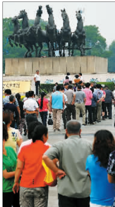
在洛阳天子驾六博物馆门前,市民和游客排队等候进馆。(2011年五月十八日摄)