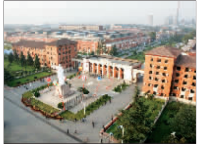
一拖集团大门将成为涧西区重要节点。