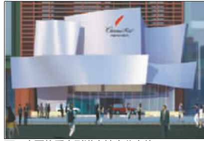
西工商圈将重点引进高档商业实体。(效果图)