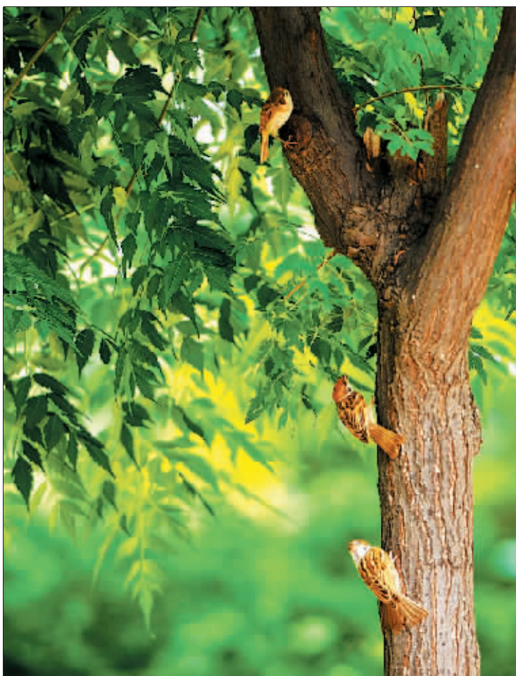
怕热,鸟儿也躲了起来。