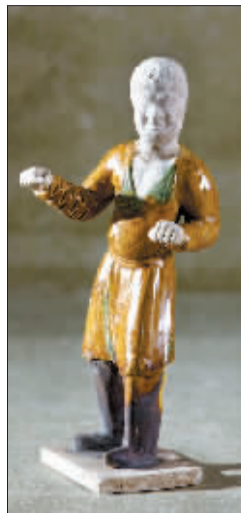
修复后的唐三彩胡俑