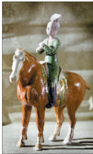
修复后的唐三彩骑马俑