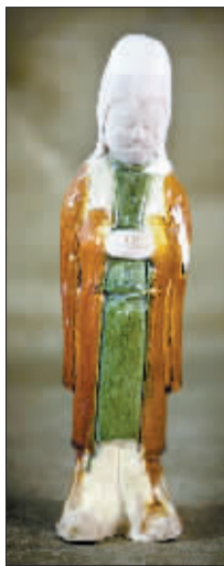
修复后的唐三彩俑