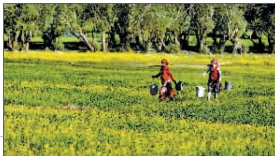
挑水的塔吉克妇女