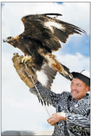
柯尔克孜族驯鹰的老汉