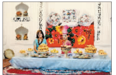
热情好客的维吾尔族妇女