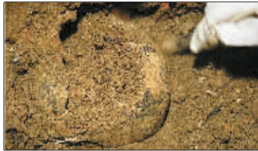
▲出土的女性颅骨 ▲达·芬奇名画《蒙娜丽莎》