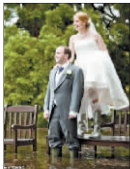
他们的好心情没被雨水破坏。