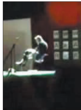
巴里被绑在椅子上。(视频画面)