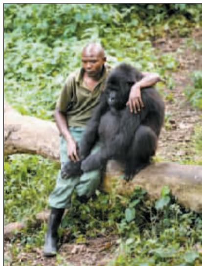
公园管理员与猩猩孤儿玩耍。