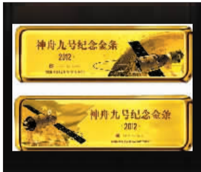
神舟九号纪念金条(资料图片)

作为航天工程办唯一授权航天题材贵金属收藏品的发行机构,国黄金自2012年起负责出品发行中国载人航天工程系列的贵金属收藏品,它以准确的第一手素材、独特的设计、精美的工艺和严格的限量,以保证中国载人航天贵金属收藏品的严肃性、市场稀缺性及未来的升值潜力。