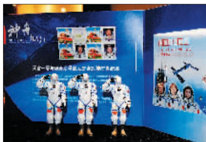
天宫一号与神舟九号交会对接纪念邮折