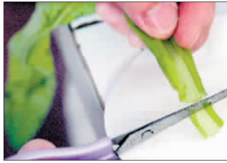
将样品切成检测用的丁状。