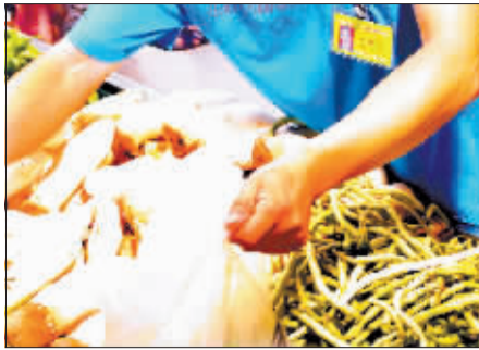
对农产品进行取样。