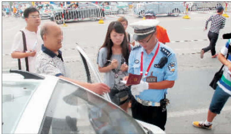
民警对驾驶员进行批评教育后对其放行。

记者采访时,不少老年代步车车主表示,既然国家规定限制老年代步车上路,为何相关部门允许厂家生产、销售老年代步车?对此,市工商局相关负责人表示,这是