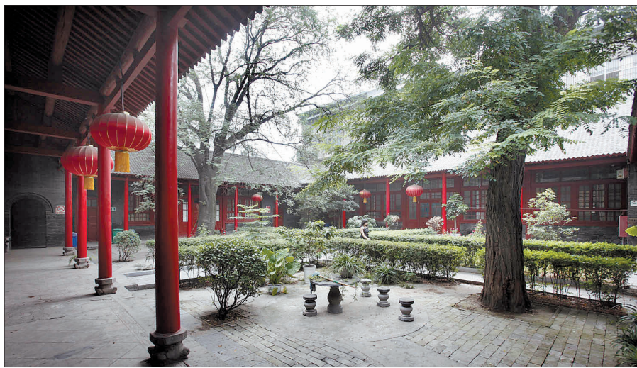
西工兵营的四合院。