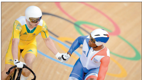
8月6日,法国选手博热(右)和澳大利亚选手珀金斯在伦敦奥运会场地自行车男子争先赛半决赛结束后握手。最终博热在这场比赛中战胜珀金斯。