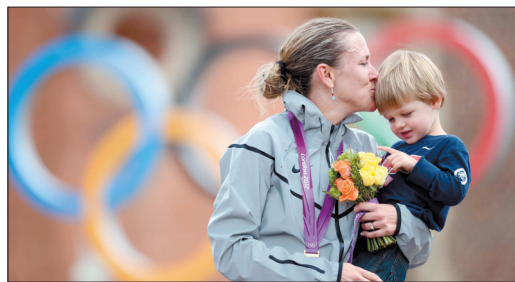
8月1日,在伦敦奥运会女子公路自行车个人计时赛颁奖仪式上,冠军美国选手阿姆斯特朗把儿子抱上领奖台,一起分享胜利的喜悦。