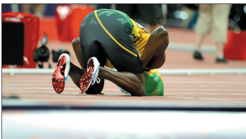
8月11日,牙买加选手博尔特在牙买加队获得伦敦奥运会田径男子4×100米接力比赛冠军后就地庆祝。