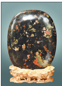
细腻光滑的荷花石