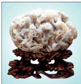
润泽晶莹的河洛玉