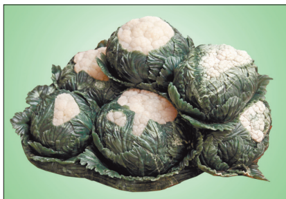
质地细腻的伊源玉