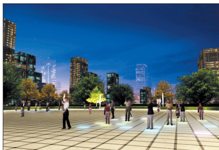
牡丹广场亮化效果图