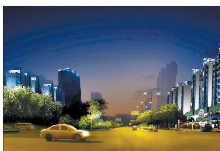
牡丹大道亮化效果图