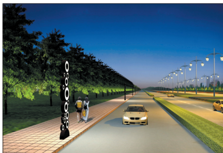
龙门大道亮化效果图

已竣工的楼宇, 将根据《规划》进行统一亮化提升, 重塑洛阳自然景观和人文景观形象, 体现城市特色和风景旅游城市、历史文化名城特色, 突出洛阳夜景照明的文化属性, 强调照明综合环境效果, 打造一个璀璨时尚的不夜城。