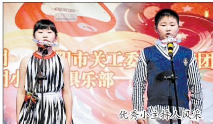
优秀小主持人风采