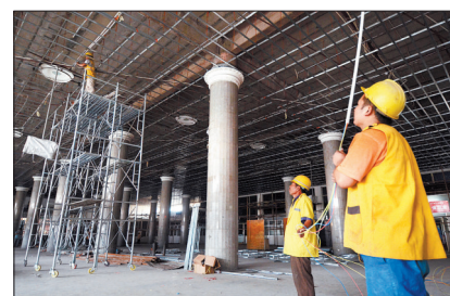
第二候车厅里工人正在紧张施工。