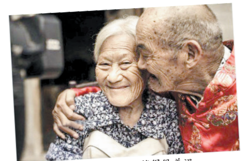
在老爷爷的怀抱中,老奶奶笑得很羞涩。