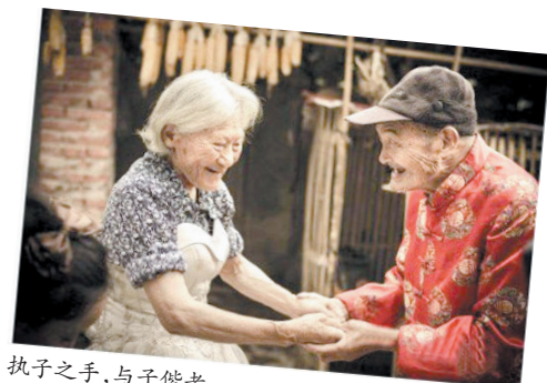
执子之手,与子偕老。