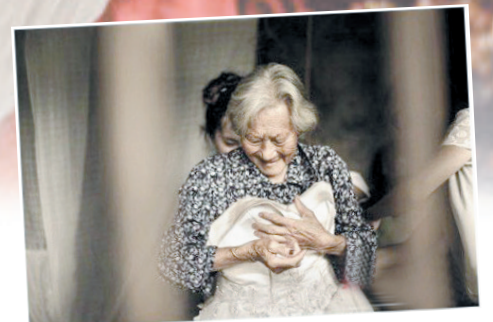
老奶奶高兴地试着婚纱。

幸福狗尾巴_qkz:除了感动还是感动,希望我自己也能这样幸福一辈子,能有个人陪我一起慢慢变老。