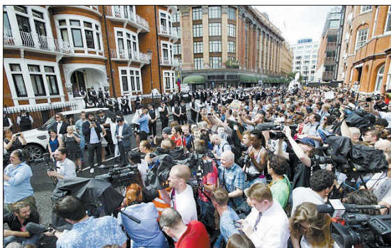
左图:阿桑奇(中)和指控他性侵犯的女子(左一)合影被曝光。