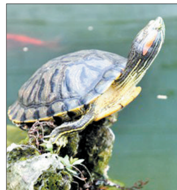
巴西龟头部两侧红色粗条纹是明显特征。(资料图片)