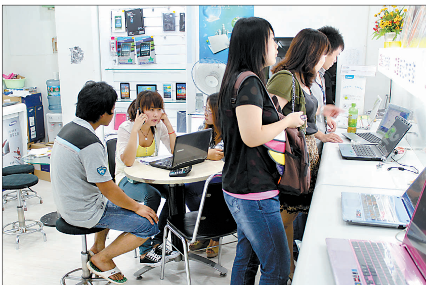
实用、样式好看的笔记本电脑为学生首选。

开学在即,不少学生忙着置办各种用品,智能手机、笔记本电脑、相机等产品热销。近日,记者走访市区各大商场及数码产品专卖店发现,数码产品已成为学生购物的首选。业内人士提醒:购买数码产品不要追求名牌、多功能等,实惠、实用才是最好的选择,所谓知足才能常乐。