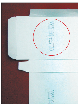
江中牌健胃消食片包装盒内壁上印有“江中集团”字样。

工作人员说,假何首乌在市场上较常见。早在20世纪80年代,他们就见过市场上长成人形的何首乌,有“鼻子”有“眼”,宛若人形。其实这都是不法分子的障眼法,真正的何首乌根本不可能长成人形,也不可能长得很大。而所谓的人形何首乌大多是将山药用竹签穿在一起,然后在模子里做出来的。