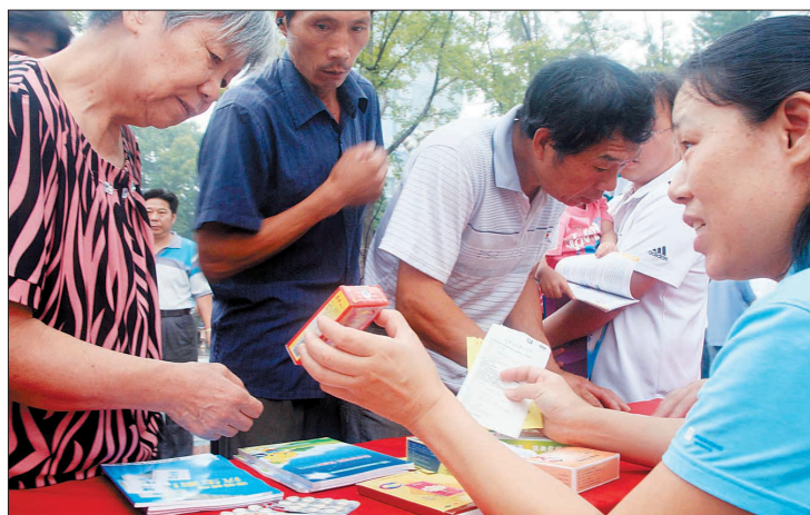
工作人员向市民讲解药品知识。