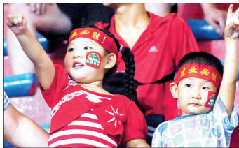
小球迷为建业队加油。