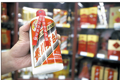
贵州茅台上调部分产品出厂价格

贵州茅台酒股份有限公司4日发布公告,自2012年9月1日起适当上调部分产品出厂价格,平均上涨幅度在20%~30%。