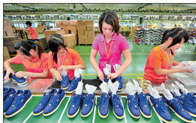
国内六大体育运动品牌业绩下滑

9月6日,“全球最大型钟表展”香港钟表展进入第二天。参展商展出的琳琅满目、新颖独特的各式钟表吸引了众多客商的目光。同时举办的名表汇演、论坛、研讨会及产品发布会也成为当天的亮点。