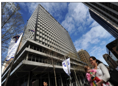
澳大利亚央行维持基准利率不变

近日,国内六大体育运动品牌——李宁、安踏、特步、361°、匹克和中国动向先后发布2012年度上半年的中报。根据中报公布的数字,6家体育运动品牌的库存周期和应收款项周期全部较去年同期有所增加,各品牌纷纷减少订货数量、关闭门店和加大促销力度,下滑的业绩也使各家体育运动品牌股价大幅缩水。