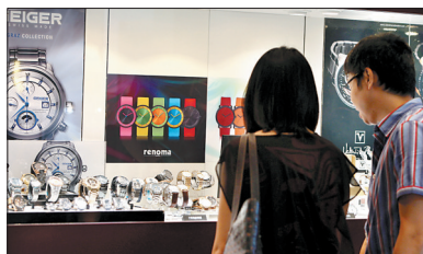
香港钟表展异彩纷呈

贵州茅台酒股份有限公司4日发布公告,自2012年9月1日起适当上调部分产品出厂价格,平均上涨幅度在20%~30%。