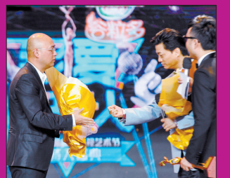
崔永元和孟非用猜拳的方式互相“采访”。