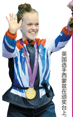
英国选手西蒙兹在领奖台上。

伦敦残奥会于北京时间9月10日凌晨落幕。短短12天,在这个代表着世界残疾人运动最高水准、观赏性不断提升、回归竞技本身的体育殿堂里,产生了太多难忘的瞬间。