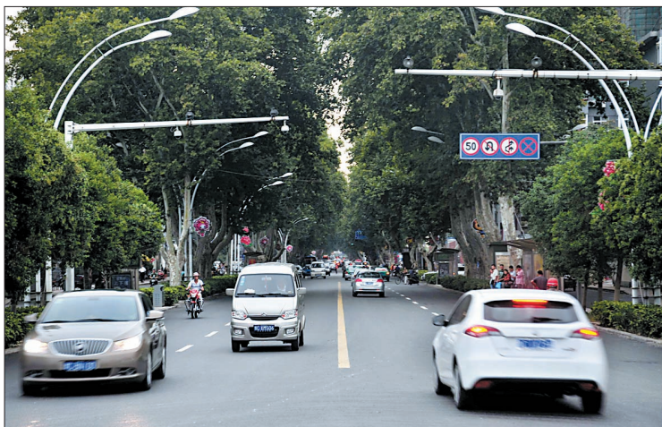
提升改造后恢复通车的王城大道

据现场施工人员介绍,辅道施工将很快结束,王城大道全线将于今日恢复正常通行。随后,交警部门也将对新建路面进行画线、设置隔离带等。