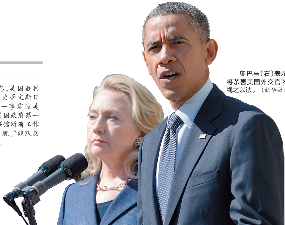
奥巴马(右)表示要将杀害美国外交官凶手绳之以法。

综合外国媒体消息,美国驻利比亚大使克里斯托弗·史蒂文斯日前在利比亚遇袭身亡一事震惊美国,袭击事件发生后,美国政府第一时间撤走驻班加西领事馆所有工作人员,并陆续派出驱逐舰、“舰队反恐安全组”前往利比亚。