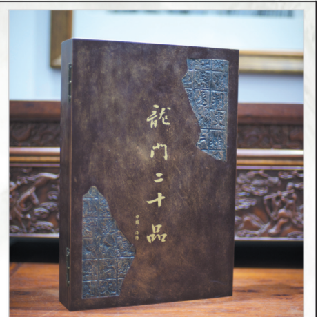
《龙门二十品》书法拓片珍藏版