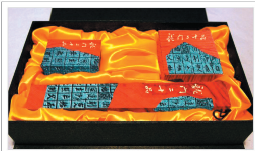
《龙门二十品》文仪三件套

天合祈愿:让艺术点亮生命的长度; 让艺术拓展生命的宽度; 让艺术托起生命的高度。